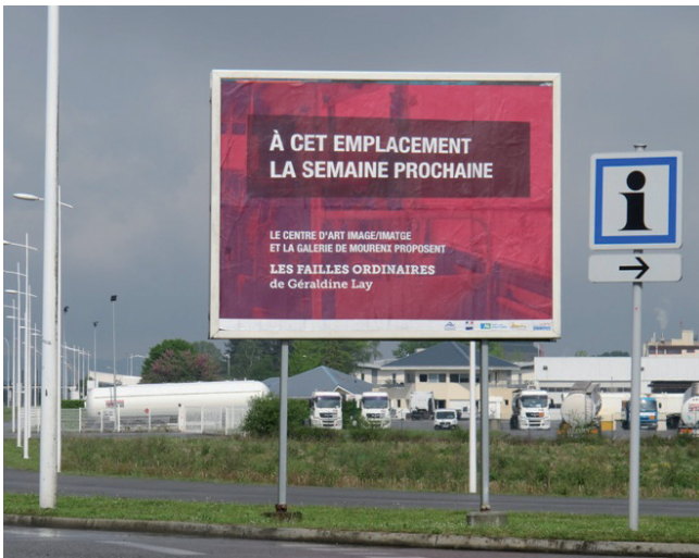
Vue du panneau situé au rond point de Lacq. Projet 12m 2 avec une œuvre de Géraldine Lay, avril-mai 2013.

Je demande que l'on fasse bien attention au contexte. À tous les contextes. À ce qu'ils permettent, ce qu'ils refusent, ce qu'ils cachent, ce qu'ils mettent en valeur. Daniel Buren