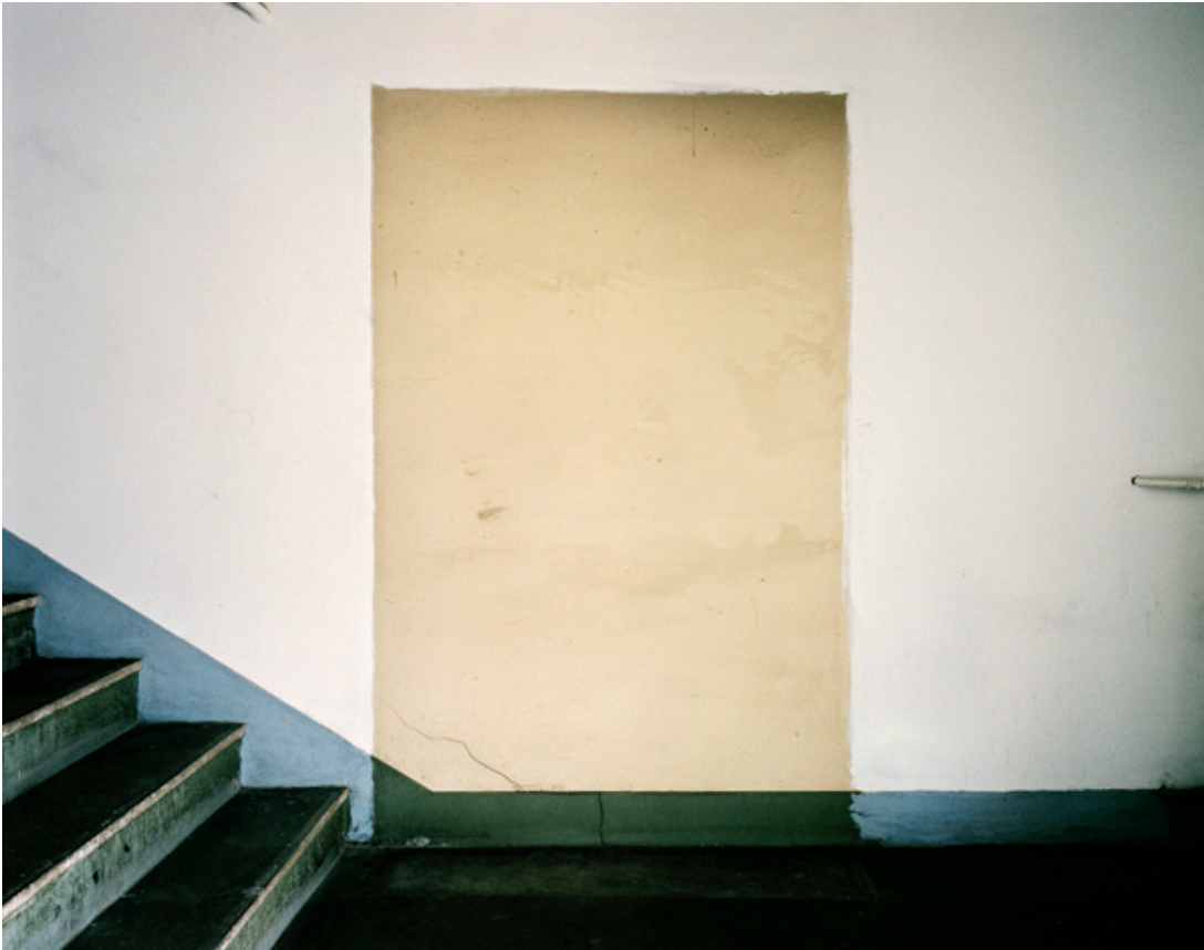
Maitexu Etcheverria, de la série Still Lifes